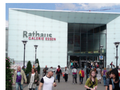
RATHAUS GALERIE Essen

Tel.: +49 40 500 977 190 Fax: +49 40 500 977 19139