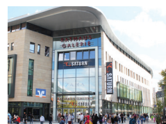
RATHAUS GALERIE - Home of Saturn - Hagen