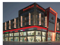
MALMÖ-PLAZA Malmö (SWE)