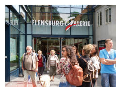
FLENSBURG GALERIE Flensburg