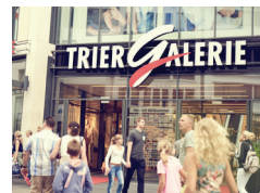
TRIER GALERIE Trier