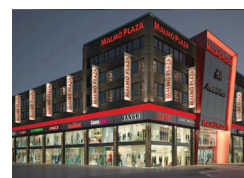
MALMÖ-PLAZA Malmö (SWE)