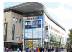
RATHAUS GALERIE - Home of Saturn - Hagen