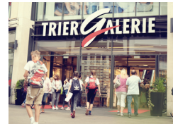
TRIER GALERIE Trier