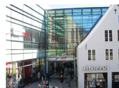
FLENSBURG GALERIE Flensburg