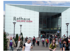
RATHAUS GALERIE Essen

Tel.: +49 40 500977190 Fax: +49 40 50097719139